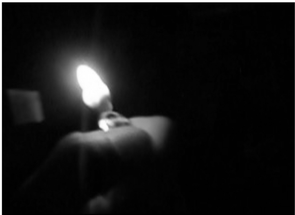
Abb. 2 bin enttäuscht, ich hatte sie anders in erinnerung