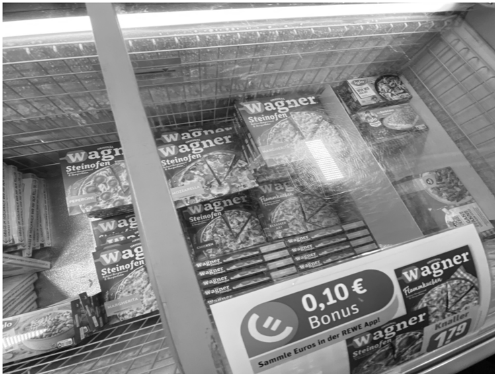
Abb. 6 aus einem abstrakten konzept