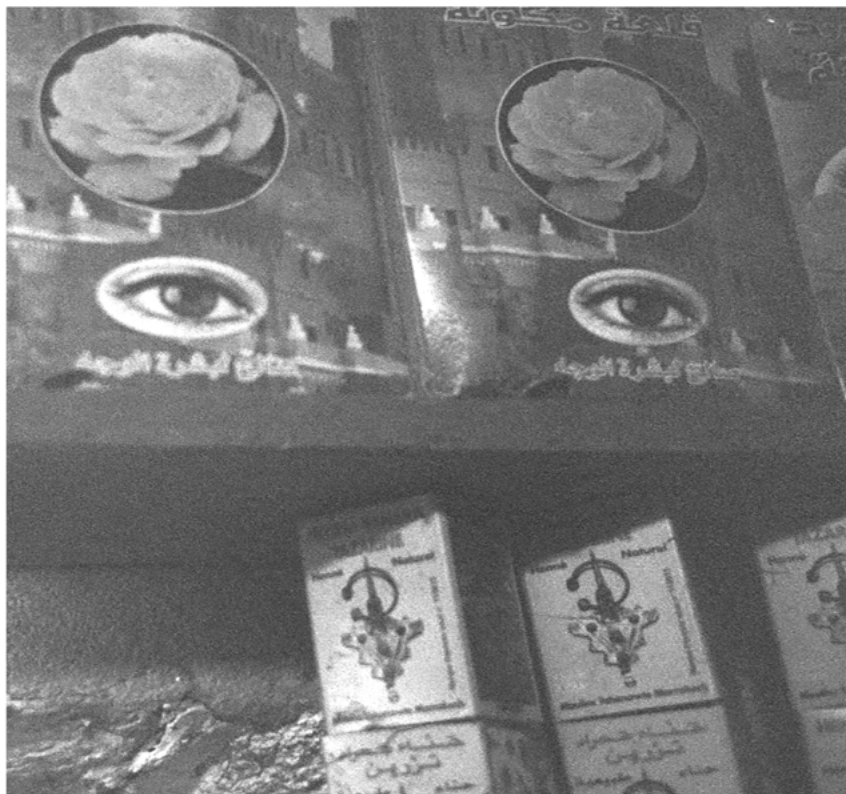
Abb. 4 nichts zu sagen haben