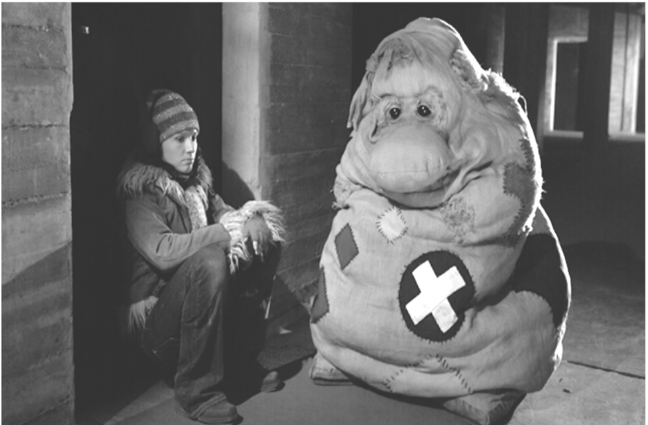
Abb. 5 saufen bockt bis man so endet

ich hab keine ideen mehr... random bilder aus meiner galerie: