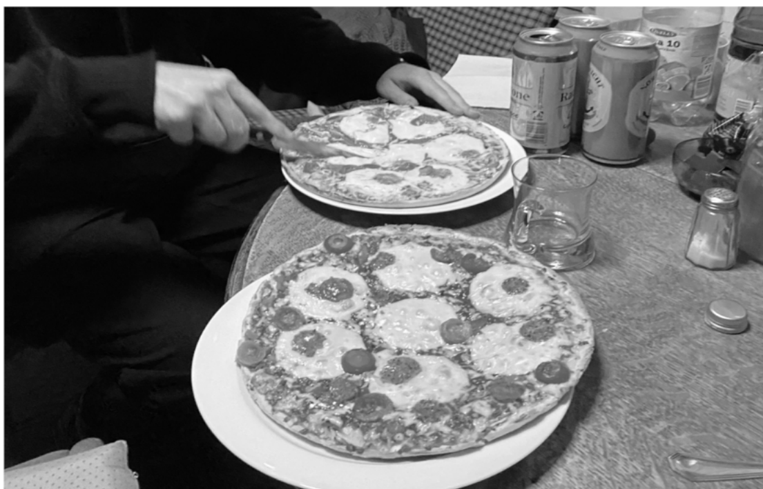
Abb. 7 wird manchmal realität