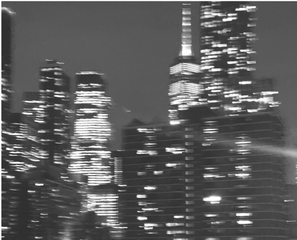
Abb. 3 gehört werden wollen